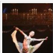
La danza come educazione