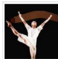
La disciplina della danza