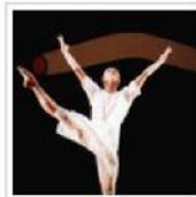
La disciplina della danza