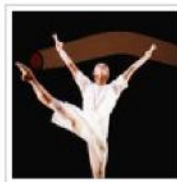
La disciplina della danza