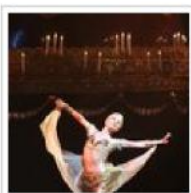
La danza come educazione