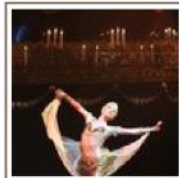
La danza come educazione