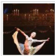
La danza come educazione